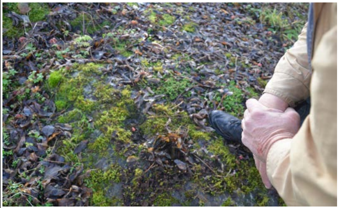
Fotografier - D :