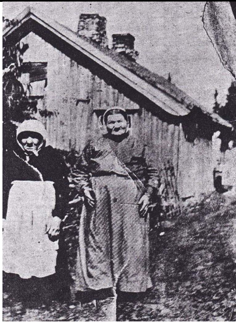
Fotografier - I :