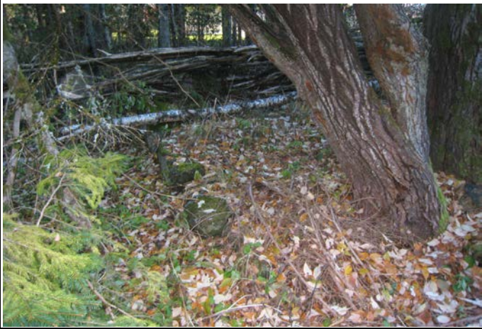
Fotografier - F :