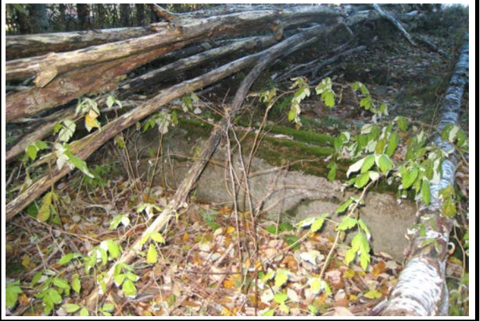
Fotografier - G :