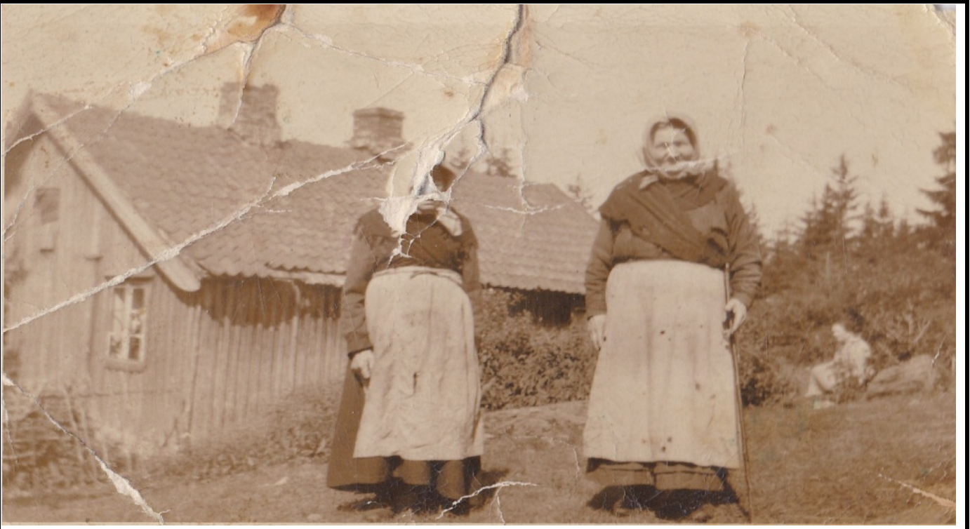
Fotografier - H :