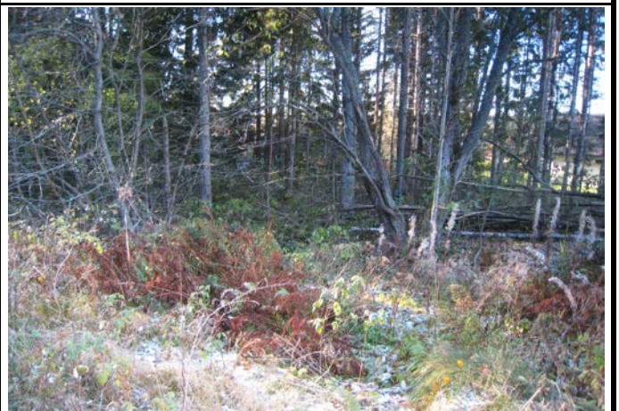
Fotografier - E :