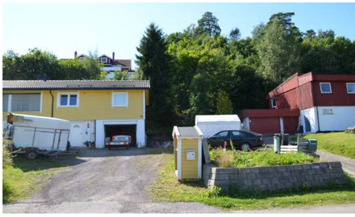
Fotografier - B :