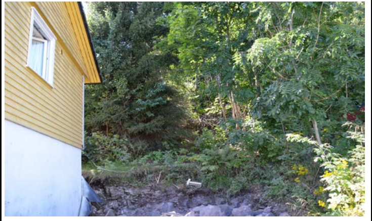
Fotografier - C :