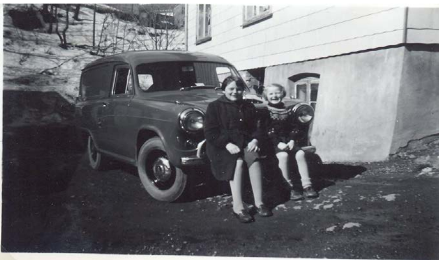
Fotografier - E :