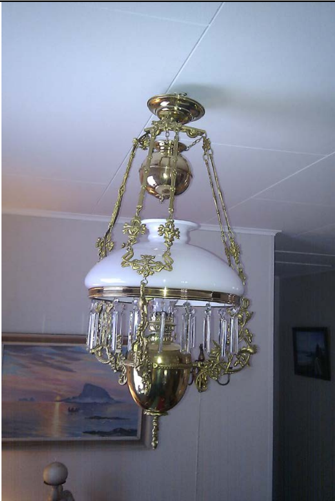
Fotografier - G :