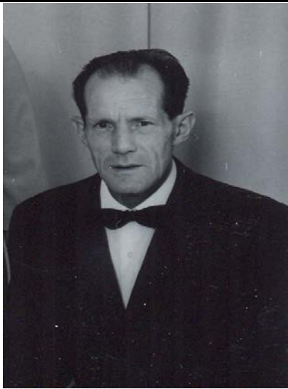
Fotografier - C :