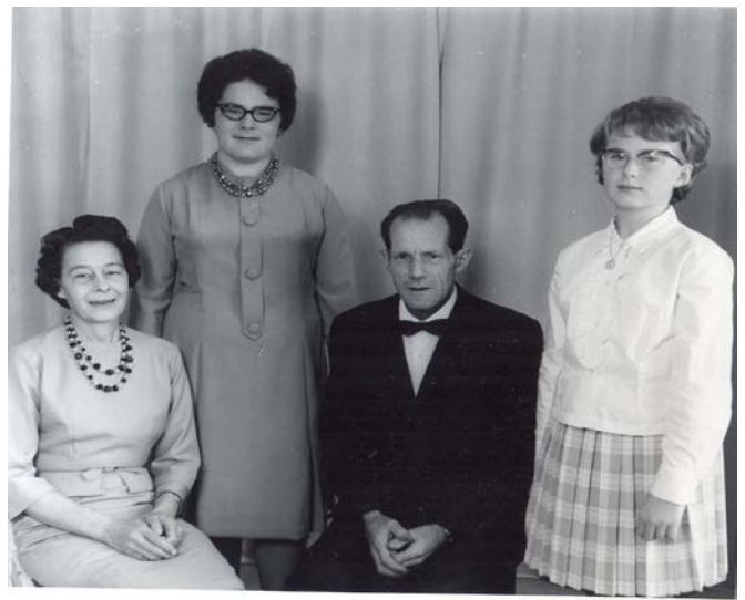
Fotografier - D :