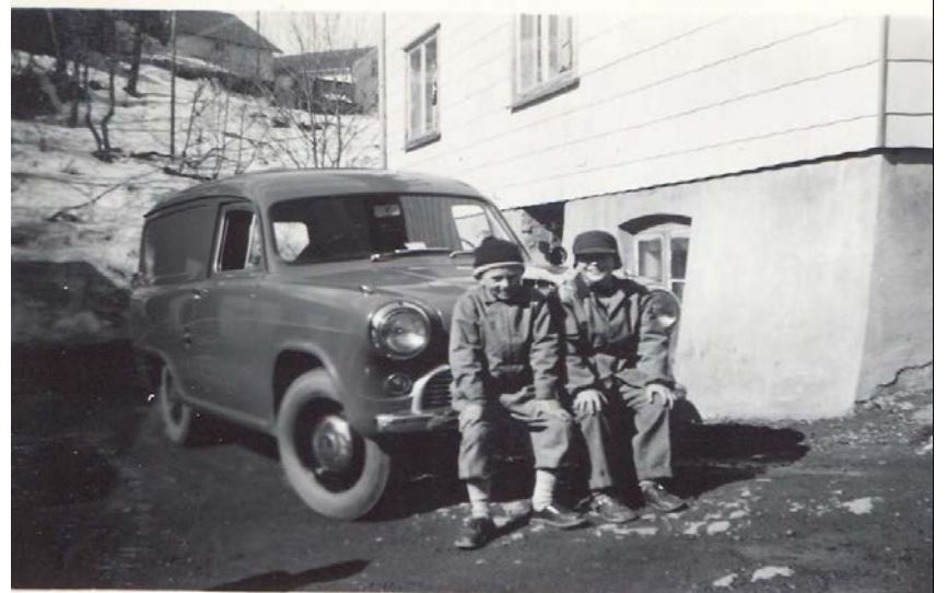
Fotografier - F :