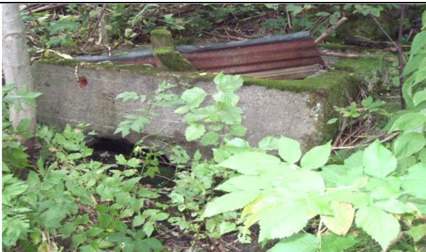
Fotografier - C :