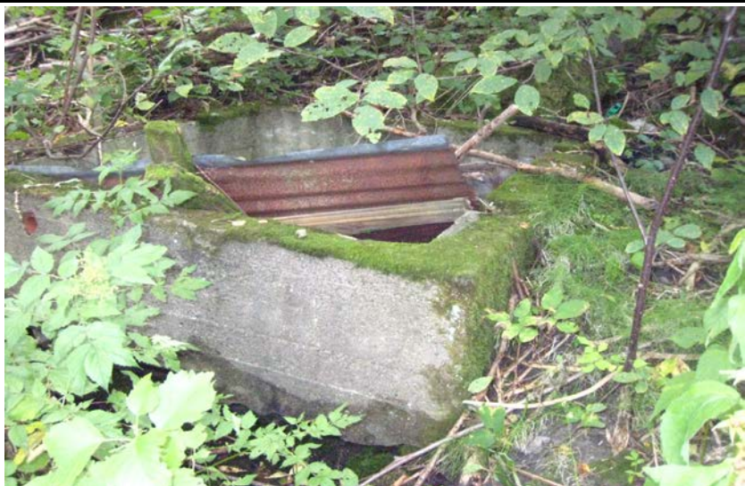
Fotografier - A :