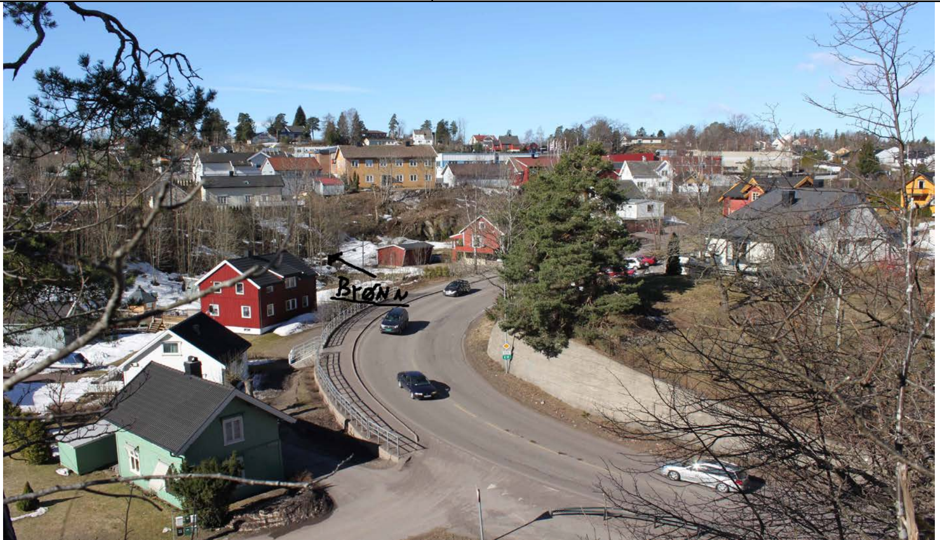
Fotografier - I: