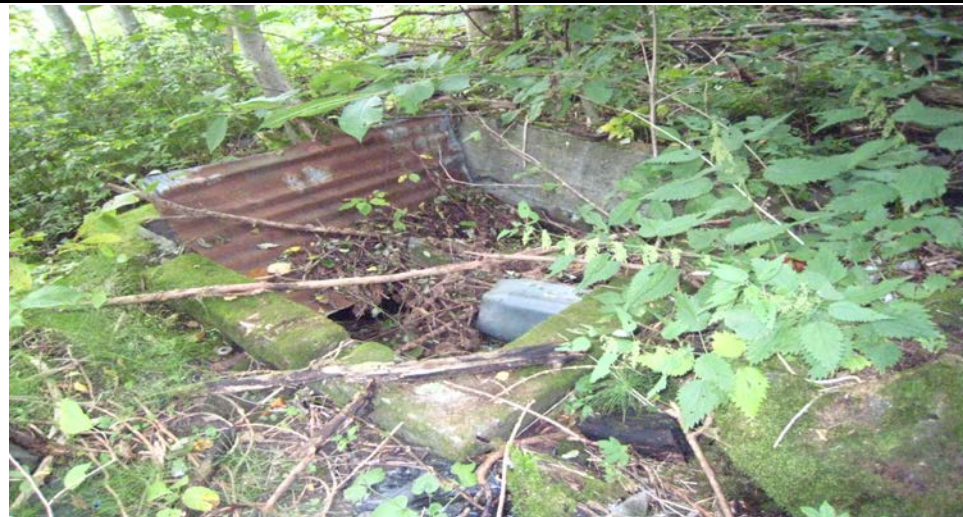
Fotografier - B: