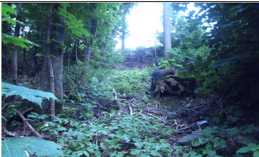
Fotografier - E :