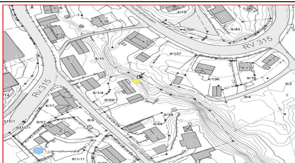
Fotografier - F :