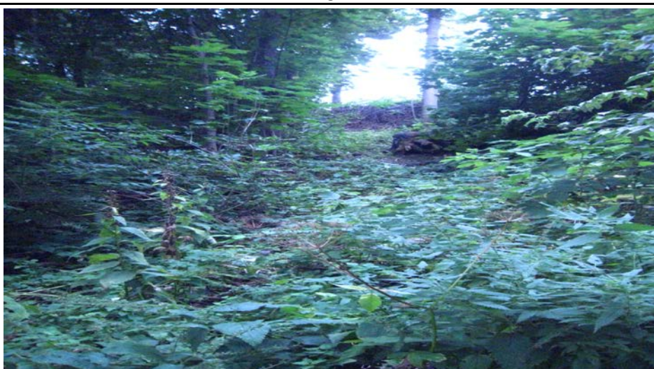
Fotografier -D :