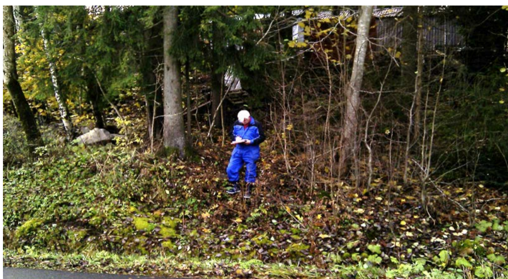
Fotografier - A :