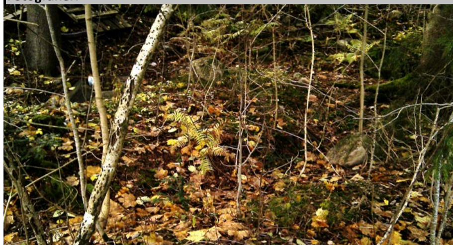
Fotografier - A :