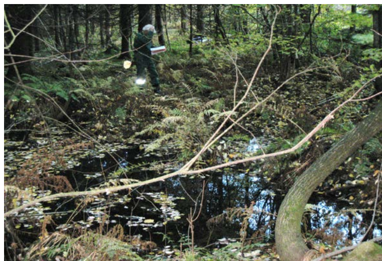
Fotografier - A :