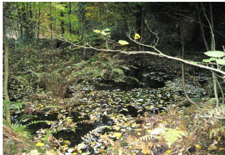
Fotografier - B: