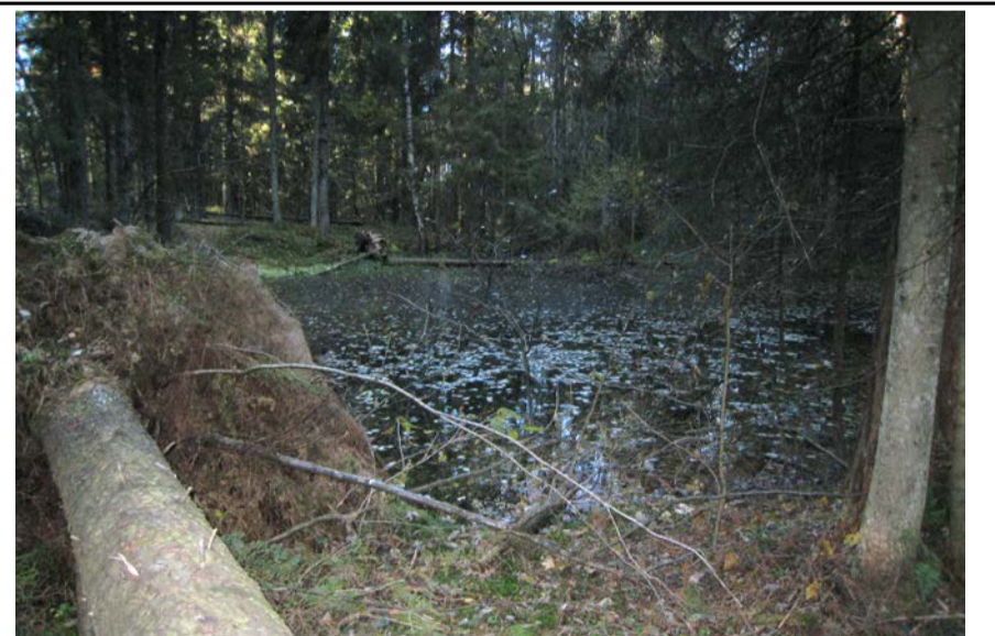
Fotografier -D :