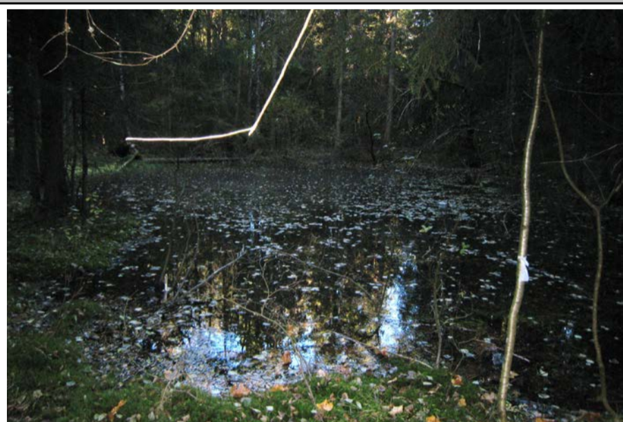
Fotografier - B: