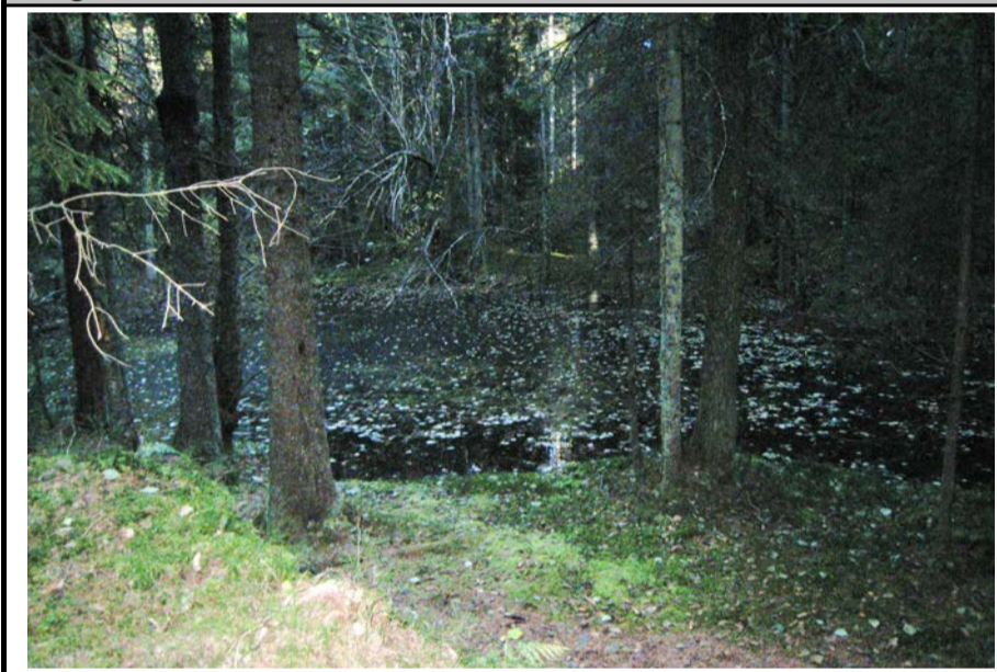
Fotografier - A :