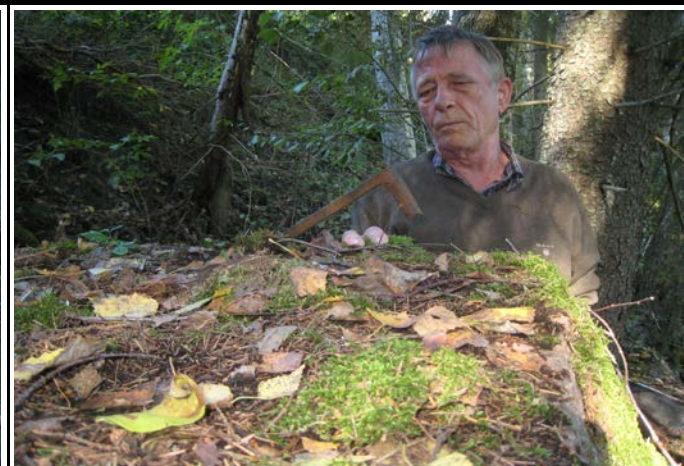
Fotografier - M :