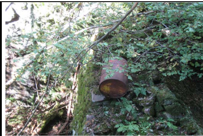
Fotografier - J :