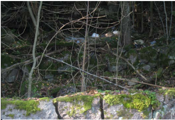
Fotografier - D :