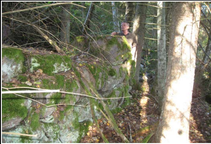
Fotografier - F :