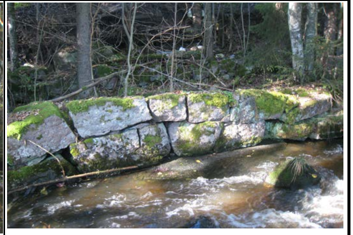
Fotografier - G :