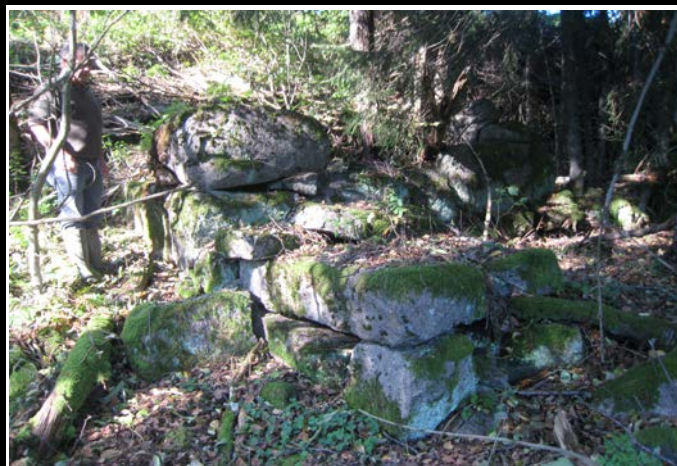
Fotografier - L :