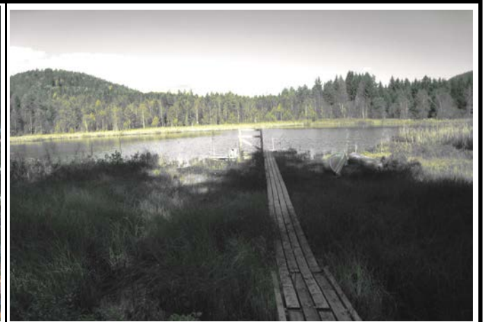
Fotografier - I :