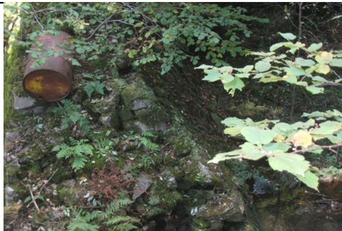
Fotografier - K :