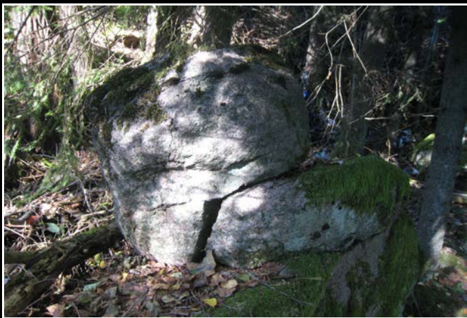
Fotografier - H :