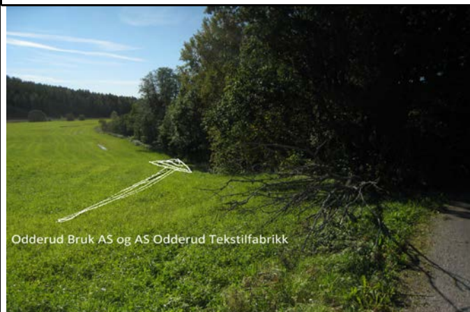
Odderud Bruk AS og AS Odderud Tekstilfabrikk