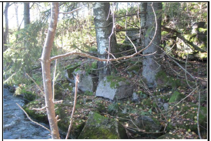
Fotografier - E :