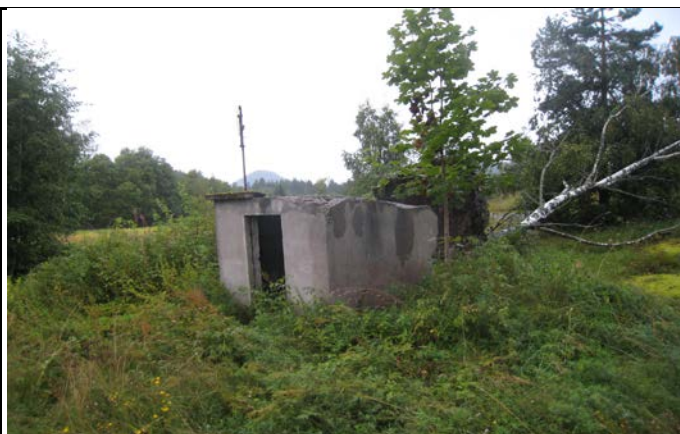
Fotografier - D :