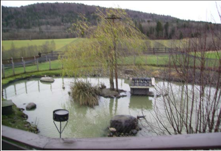
Fotografier - B :