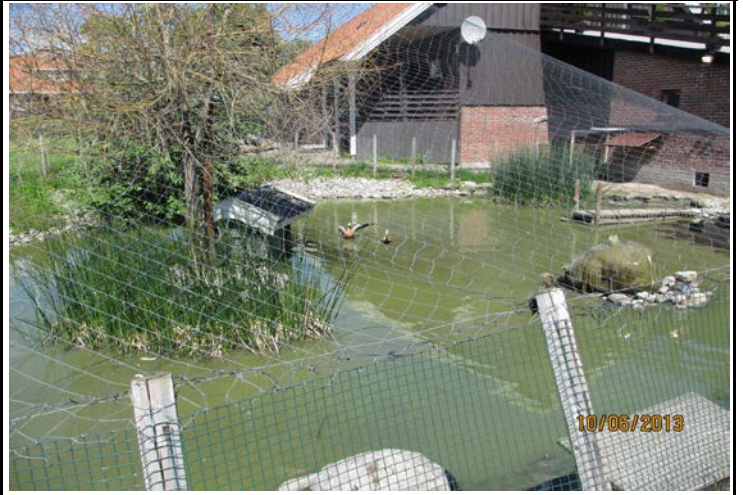
Fotografier - C :