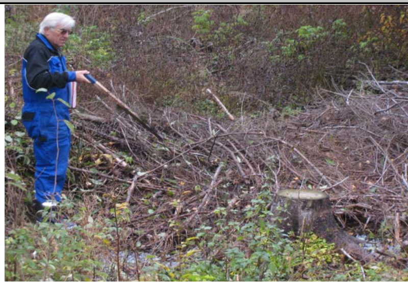
Fotografier - B: