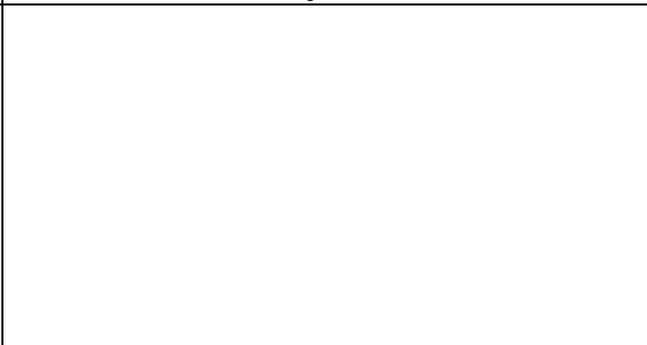
Fotografier - E :