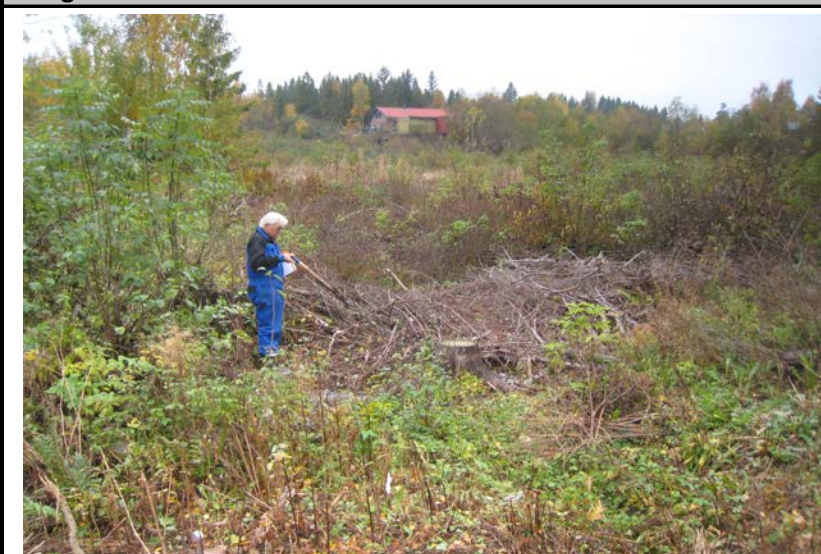
Fotografier - A :