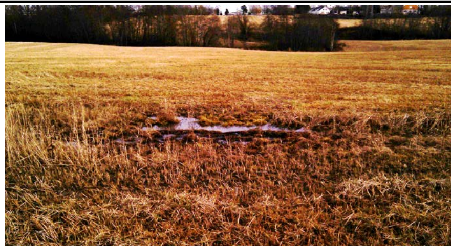
Fotografier - B: