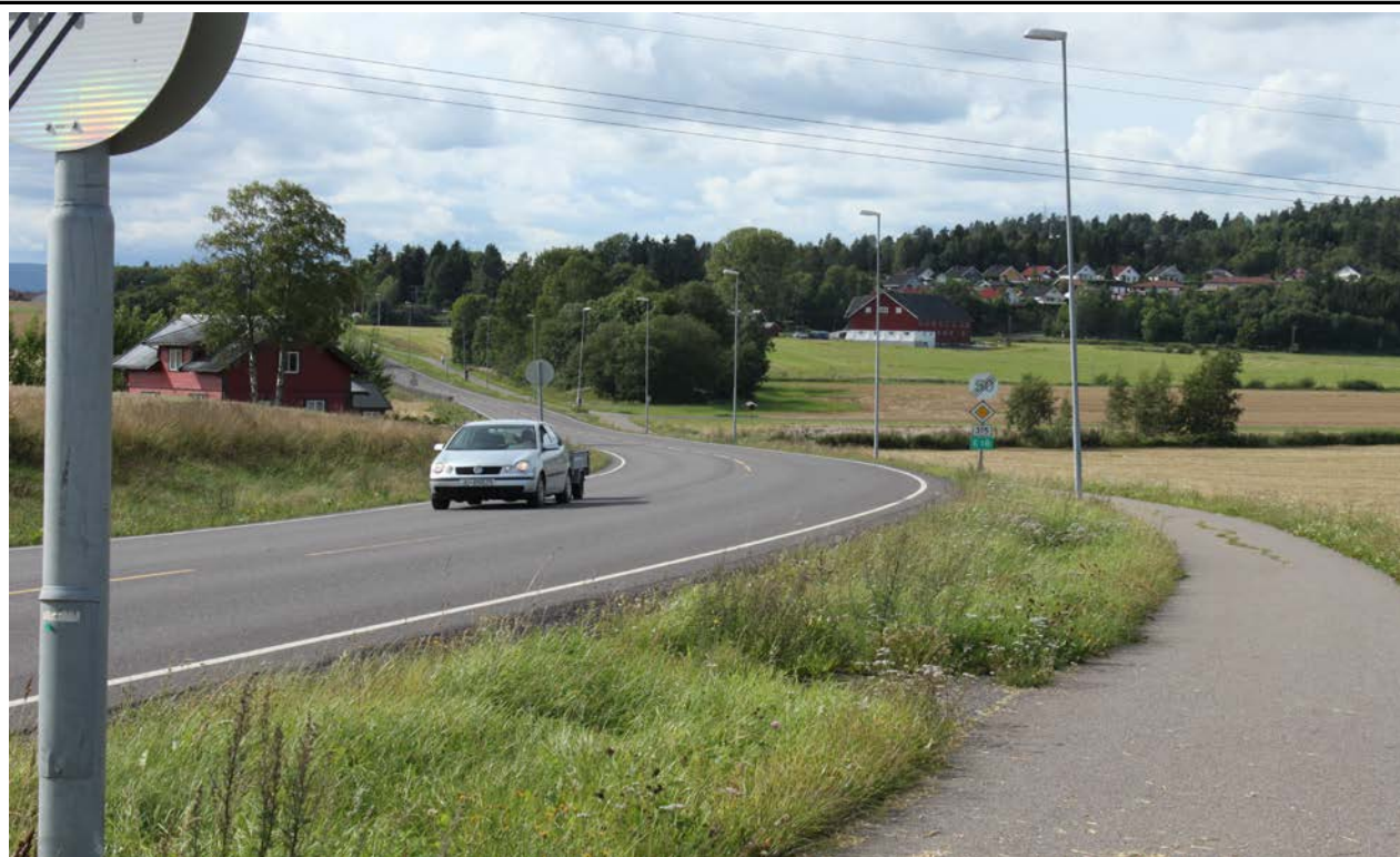
Fotografier - A :