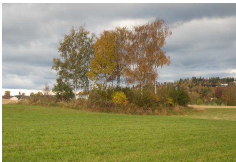
Fotografier - A :