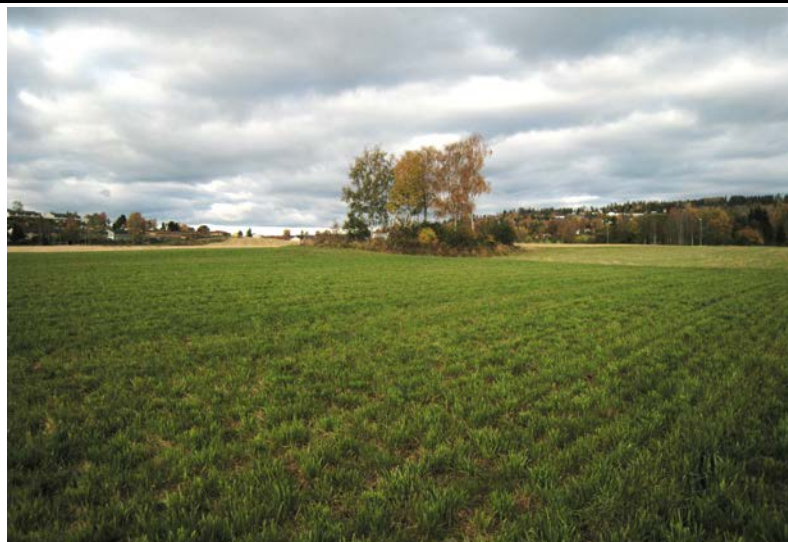
Fotografier - B: