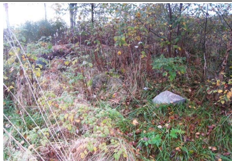
Fotografier -D :