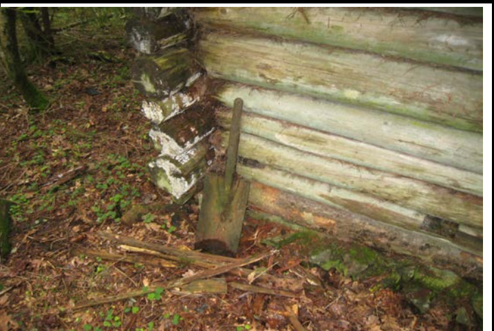
Fotografier - K :