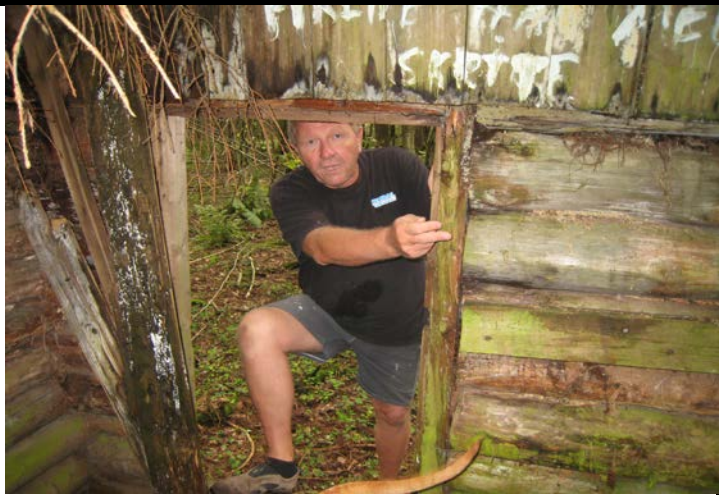
Fotografier - H :