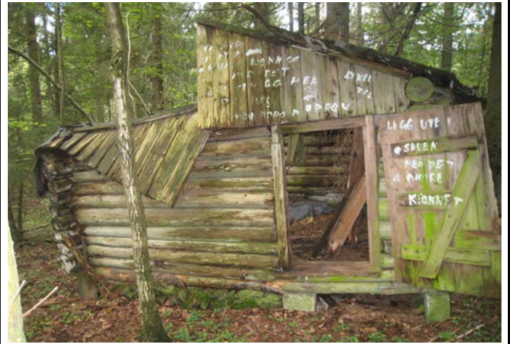
Fotografier - G :