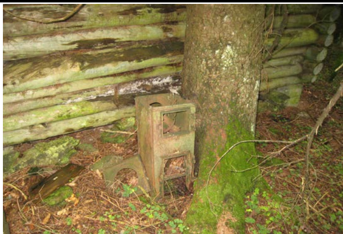
Fotografier - J :