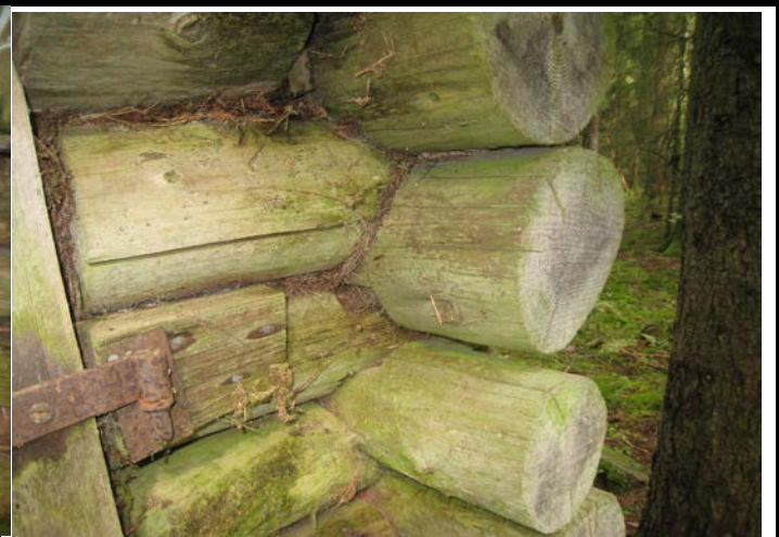
Fotografier - I :