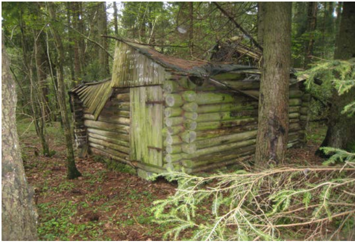
Fotografier - F :