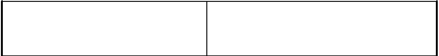
Fotografier - D :