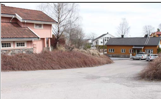
Fotografier - C :