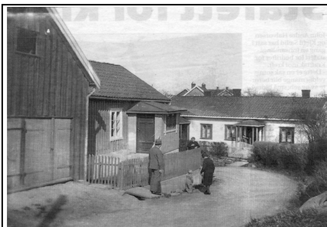
Fotografier - B :