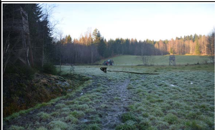
Fotografier - E :